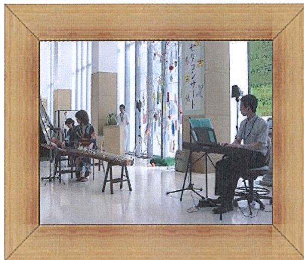
和楽器・キーボードのコラボレーション による童謡メドレー (職員&ご親族)