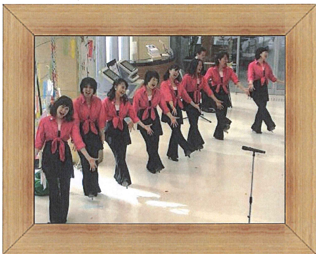
ピアノ演奏&コーラス (レディースボーカルソサエティの皆さん)

7/8 (金) 16時より、病院ロビーにて第5回 七タコンサートを開催しました。七タコンサートの開催は2年ぶりで、職員他の方々による演舞・演奏などが披露されました。入院患者さまを中心に会場は大いに盛り上がり、最後にはアンコールのお声をいただくほどでした。