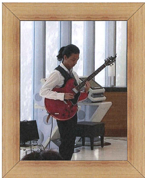
ジャズ演奏 (職員ご親族)